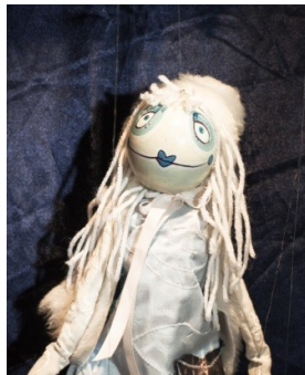
La Reine des Marées