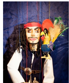
Le pirate Barbelé et son coq Barbillon